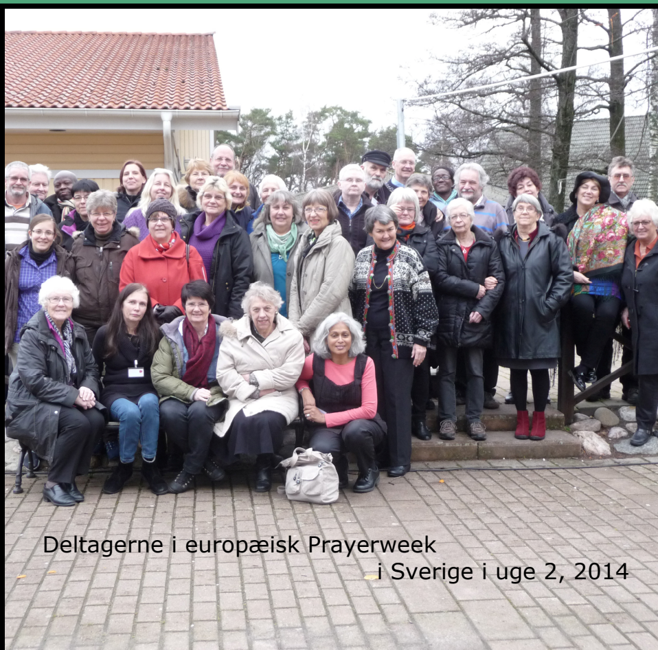
Deltagerne i europæisk Prayerweek i Sverige i uge 2, 2014

“Som faderen har sendt mig, sender jeg jer”