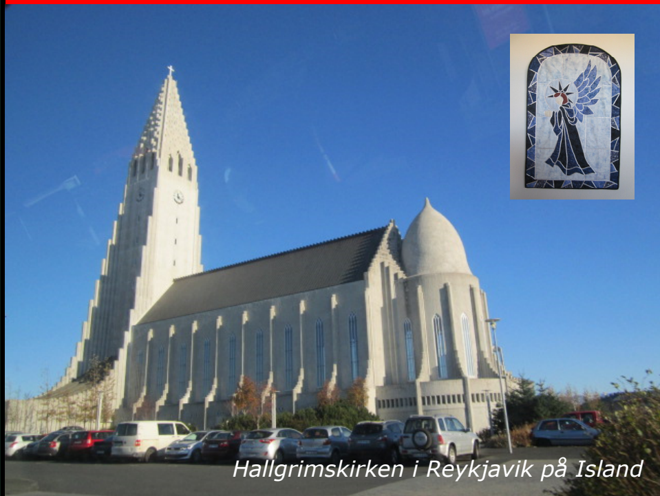
Hallgrímskirkjen i Reykjavík på Island

”Som faderen har sendt mig, sender jeg jer” Johs.