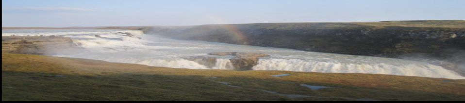
Gullfoss i Island

det kristne menneskesyn i social- og sundhedssektoren