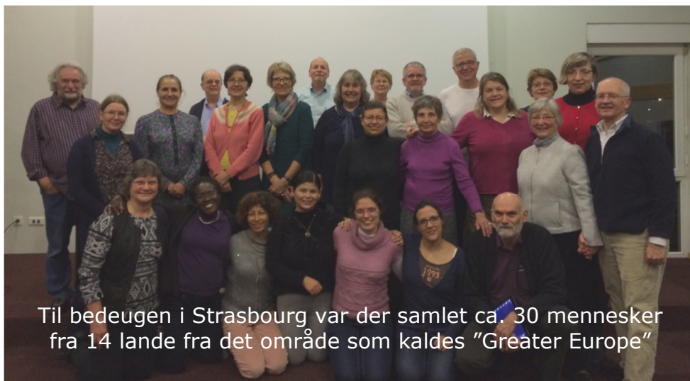
Til bedeugen i Strasbourg var der samlet ca. 30 mennesker fra 14 lande fra det område som kaldes "Greater Europe"