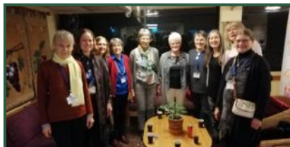
HCF Europa Prayerweek i Israel 2020. Nordens 11 deltagere ud af 48 fra 14 lande.