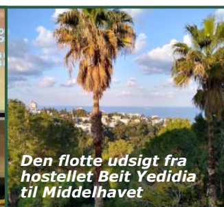
Den flotte udsigt fra hostellet Beit Yedidia til Middelhavet