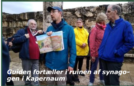
Guiden fortæller i ruinen af synagogen i Kapernaum