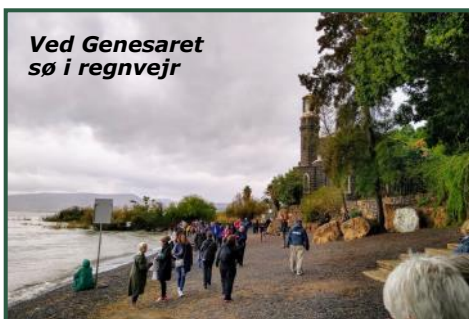
Ved Genesaret sø i regnvejr