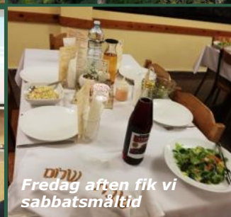
Fredag aften fik vi sabbatsmåltid