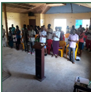
Blojays kaldelse er: Uddannelse til den nye generation. Her ser du skoleelever og studenter og til højre en gudstjeneste - mens tagene stadig var tætte!