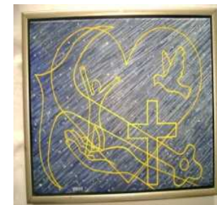
maleri af Villy Holm

Sted: Kirkeladen ved Græse kirke Græse Bygade 25 3600 Frederikssund